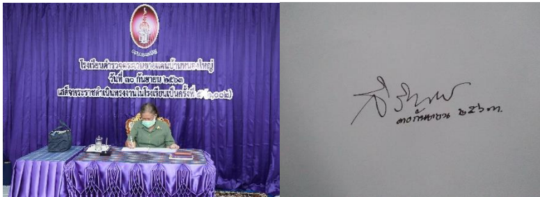
ภาพที่ 8 โรงเรียน ตชด.บ้านหนองใหญ่. (2563, ตุลาคม 8). เสด็จฯ ติดตามโครงการ อันเนื่องมาจากพระราชดำริและลายพระหัตถ์พระราชทาน (ภาพถ่าย)

อดทนในการทำมาหากิน นอกจากการทำมาขอให้ทำอาชีพเสริมเพื่อเป็นการเพิ่มพูน รายได้อีกทางหนึ่ง แล้วทรงขอให้ทุกคนสามัคคีกลมเกลียวกันเพื่อชาติบ้านเมืองต่อไป (นิเชต ฤทธิ์สิทธิ์, 2563, สัมภาษณ์) ดังลายพระหัตถ์พระราชทานในวาระครบ 60 ปี โรงเรียนตำรวจตระเวนชายแดน ความว่า “60 ปี โรงเรียน ตชด.ดำเนินการมา นำความสุขแก่ประชาชน” “ขอให้กิจการโรงเรียนตำรวจตระเวนชายแดนเจริญรุ่งเรือง เป็นประโยชน์ต่อประเทศชาติสืบต่อไป” และ “ขอให้ดำเนินการได้ดี มีความปลอดภัย รักษาประเทศให้อยู่คง” (กองบัญชาการตำรวจตระเวนชายแดน, 2559, น.คำนำ) ทั้งนี้ ประเด็นการแก้ปัญหาความยากจนจึงกลายเป็นเป้าหมายสูงสุดของโครงการ อันเนื่องมาจากพระราชดำริและโครงการพัฒนาทุกประเภทของรัฐ เนื่องจากการ ดำเนินการพัฒนาทั้งหมดล้วนเป็นการพยายามแก้ต้นตอของความยากจนตามความคิด ความเชื่อ และความรับรู้ของรัฐเวลานั้น