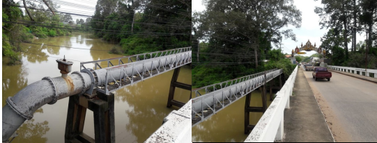
ภาพที่ 1, 2 ห้วยสำราญในบริเวณที่ไหลผ่านย่านท่าเรือเดิมของเมืองศรีสะเกษ ที่มา : ชาญพงศ์ สารรัตน์ 25 สิงหาคม 2561

การผสมผสานทางสังคมและวัฒนธรรมระหว่างท้องถิ่นต่าง ๆ จนทำให้เมืองศรีสะเกษมีความเจริญและมีวัฒนธรรมเป็นเอกลักษณ์ของตน