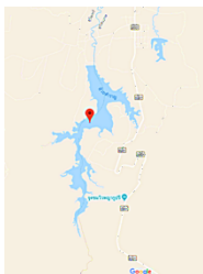
ภาพที่ 5 พื้นที่อ่างเก็บน้ำห้วยสำราญทางตอนใต้ของจังหวัด ที่มา: www.googleearth.com 25 สิงหาคม 2561

ระบบลำน้ำที่ดี ที่ราบเหล่านี้จะเป็นที่ตั้งของหมู่บ้านชานา ซึ่งมีความอุดมสมบูรณ์ด้วยอาหารและผลไม้ เป็นหมู่บ้านที่พึ่งพาตนเองได้และมีความเกาะเกี่ยวกันในด้านความสัมพันธ์ทางเครือญาติ มีการนับถือผี ไสยศาสตร์ และพุทธศาสนา แต่หมู่บ้านชานาเหล่านี้ไม่ใช่ชุมชนปิดดั่งเช่นหมู่บ้านชานาในตอนหรือหุบเขา เพราะสามารถเดินทางไปมาติดต่อชุมชนชานาอื่น ๆ และกับเมืองโดยใช้เรือเป็นพาหนะไปตามลำน้ำลำคลอง ทั้งยังสามารถเดินทางไกลออกไปได้ตราบเท่าที่มีแม่น้ำลำคลองเชื่อมโยงต่อกันไป