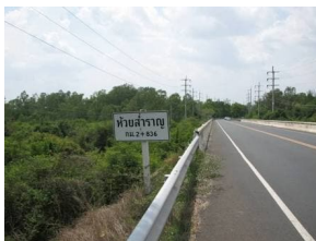
ภาพที่ 6 ห้วยสำราญบริเวณชานเมืองศรีสะเกษ

2. ระบบลำน้ำ: บ่อเกิดแห่งวัฒนธรรมศรีสะเกษ ศรีสะเกษอยู่ในบริเวณที่ราบลุ่มแม่น้ำลำคลองมากในอดีตมาก่อนที่จะมีถนนตัดผ่านประชาชนทั่วไปตั้งบ้านเรือนอาศัยอยู่ตามริมฝั่งแม่น้ำลำคลอง แม่น้ำลำคลองโดยเฉพาะห้วยสำราญจึงเข้ามามีส่วนสำคัญต่อชีวิตความเป็นอยู่ของชาวศรีสะเกษ กิจกรรมและขนบธรรมเนียมประเพณีต่างๆจึงขึ้นอยู่กับการอาศัยน้ำเข้ามาเป็นส่วนประกอบที่สำคัญ ได้แก่ ที่อยู่อาศัย การสร้างที่อยู่อาศัยของชาวเมืองศรีสะเกษจะใช้วัสดุที่มีอยู่ในท้องถิ่น ได้แก่ ใบจาก หญ้าคา หญ้าแฝก ต้นไผ่ รวมทั้งไม้เนื้อแข็ง ชาวบ้านเรียกว่า “ไม้จริง” ซึ่งได้จากป่าไม้ทางตอนเหนือแล้วล่องซุงลงมาตามลำน้ำ ส่วนมากใช้ปลูกบ้านของชนชั้นสูงซึ่งได้แก่ เจ้านาย ขุนนาง และผู้มีฐานะมั่งคั่ง (สุพร สิริพัฒน์, 2542, น.40) ในส่วนอาหารการกินนั้น ศรีสะเกษอยู่ในพื้นที่อุดมสมบูรณ์ มีทั้งข้าว ผัก ผลไม้ กุ้ง หอย ปู ปลา ที่นำมาประกอบอาหารประจำวันได้ มีป่าริมห้วยที่เปรียบเสมือนห้างสรรพสินค้าหรือเซเว่นอีเลฟเว่นของคนท้องถิ่น (ศูนย์ศรีสะเกษศึกษา, 2550, น.61) อาหารนั้นมีทั้งชนิดที่ต้องผสมผสานกับของกินอื่น ๆ และรับประทานได้โดยไม่ต้องผสมสิ่งอื่น โดยแบ่งเป็นอาหารคาวหวานและผลไม้ ซึ่งได้มาจากลำน้ำทั้งทางตรงและทางอ้อมทั้งสิ้น มีการแต่งกายที่รัดกุมและสะดวกต่อการลงเรือ ส่วนเรือที่ใช้ในการเดินทางในห้วยสำราญนั้น หากเดินทางไประยะไกลต้องใช้เรือขนาดใหญ่ มีประทุนไว้บังแดด และเพื่อหลบร้อนตอนค่ำคืน เรือจึงถือว่าเป็นของใช้ที่สำคัญอย่างหนึ่งที่ชาวบ้านต้องมีไว้ใช้ เมื่อถึงฤดูแล้งจึงมีการซ่อมแซมเรือ โดยใช้อุปกรณ์ที่สำคัญ คือ ชันผสมน้ำมันยางยาเรืออุดรอยรั่ว และทาตัวเรือด้วยน้ำมันยางเป็นการรักษาเนื้อไม้มิให้ผุเร็วก่อนเวลาอันควร (แหล่งเดิม, 2550, น.55)