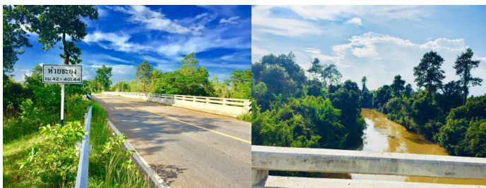
ภาพที่ 7 ห้วยชะียง กลุ่มน้ำสำคัญบริเวณรอยต่อ อ.โนนคูณ และ

ดังนั้น จึงกล่าวได้ว่าปริมาณน้ำในห้วยสำราญและลำน้ำสาขามีส่วนสำคัญต่อชีวิตความเป็นอยู่และวัฒนธรรมคนศรีสะเกษ ถึงแม้การคมนาคมทางบกจะเจริญขึ้นมากแล้วก็ตามในปัจจุบัน และวัฒนธรรมมินน้ำก็ยังคงอยู่ในบางท้องถิ่นของเมืองศรีสะเกษ